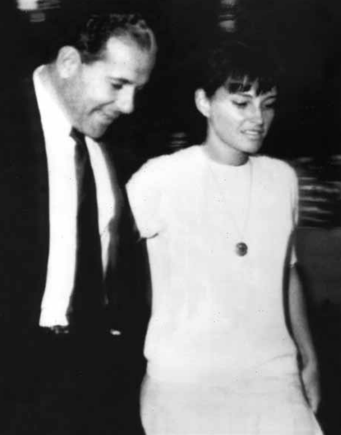
João Goulart e sua esposa, Maria Tereza Goulart. Montevidéu, 4 de maio de 1964.