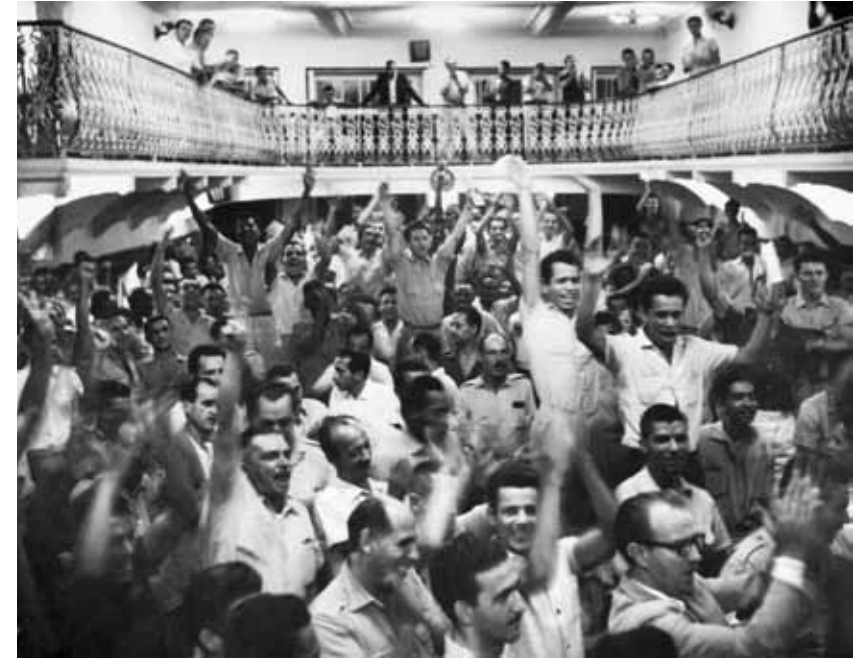
Assembleia do Sindicato dos Condutores de Veículos Rodoviários e Anexos do Estado da Guanabara decide a realização de uma greve geral por melhores salários. [Rio de Janeiro], 10 de outubro de 1961. Correio da Manhã

O "Trem da Carestia", recoberto de cartazes com dizeres sobre o aumento do custo de vida, foi promovido pelas Ligas Femininas do Estado da Guanabara com o apoio da Federação Nacional dos Ferroviários e de vários sindicatos. [Rio de Janeiro], 8 de março de 1963. Correio da Manhã