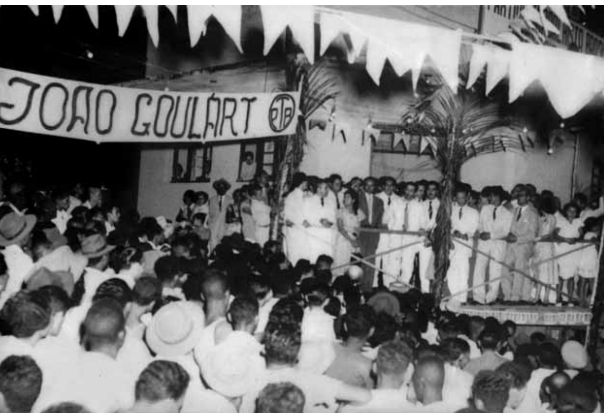
João Goulart, ministro do Trabalho, Indústria e Comércio, discursa em palanque durante visita a Pernambuco. S.l., 25 de outubro de 1953. João Goulart

As roupas produzidas e consumidas no período que se estende de meados dos anos 1950 à primeira metade da década de 1960 são um convite à reflexão sobre as relações de gênero, a sexualidade, o protagonismo da juventude, a inserção feminina nas universidades e no mundo do trabalho. Na indumentária de homens e mulheres fica evidente o papel que o cinema, os músicos e grupos de rock-and-roll e a literatura e a estética beatnik possuíam na conformação dos novos padrões de comportamento, ajudando a quebrar regras que se expressavam no que tange à moda, na obrigação de seguir os ditames da alta-costura, em vigor por cerca de cem anos.