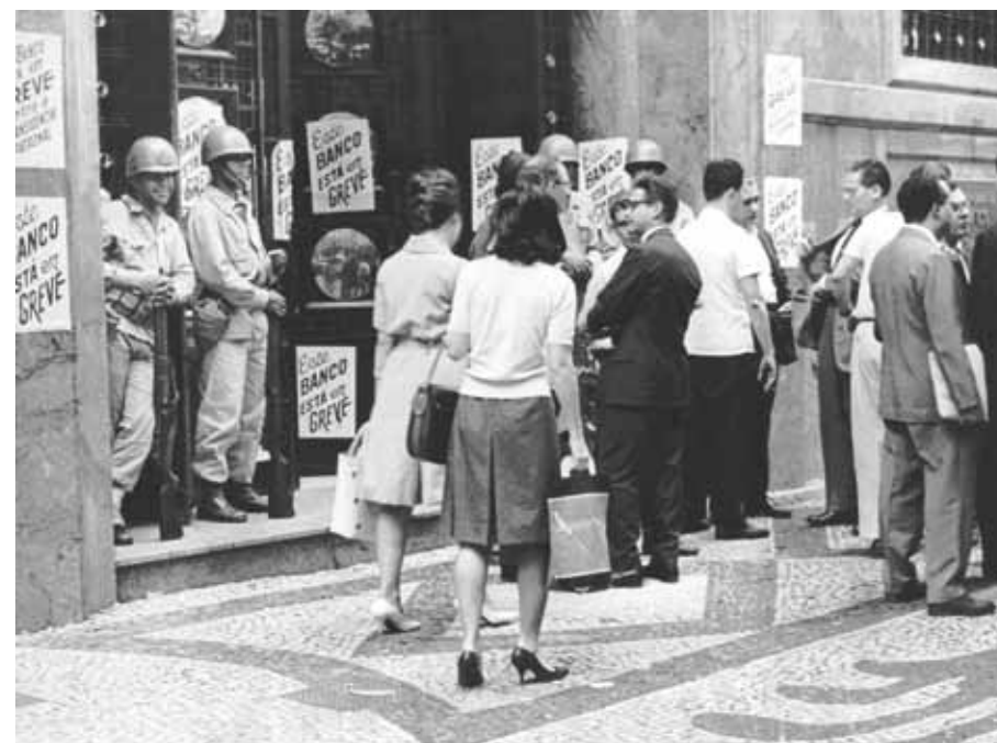
Greve dos bancários. Rio de Janeiro, 13 de setembro de 1963.