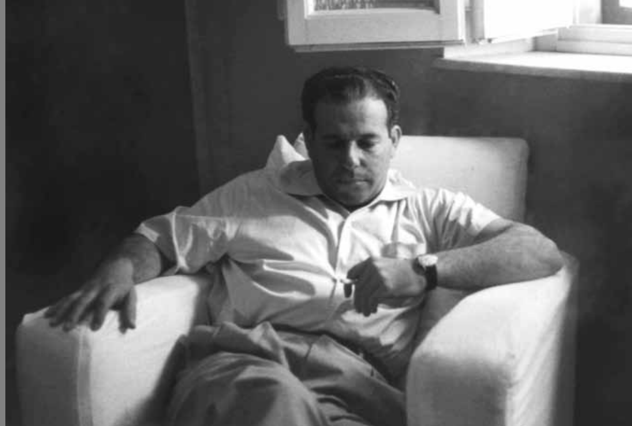
João Goulart, presidente da República, sentado durante seu exílio no Uruguai. Montevidéu, s.d. João Goulart