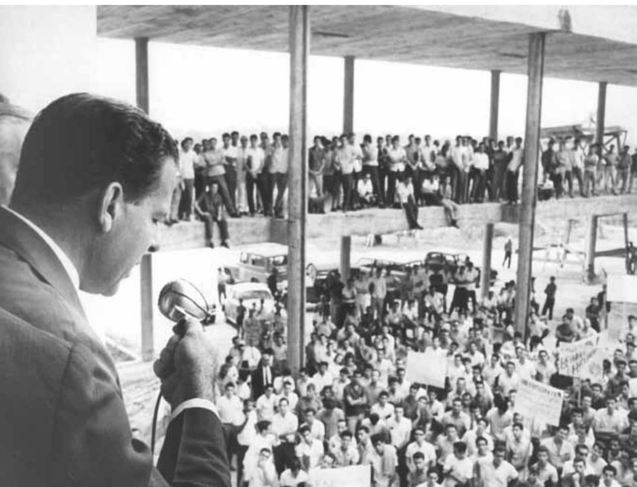
O presidente João Goulart discursa para estudantes no Fundão. Rio de Janeiro, 23 de agosto de 1963.