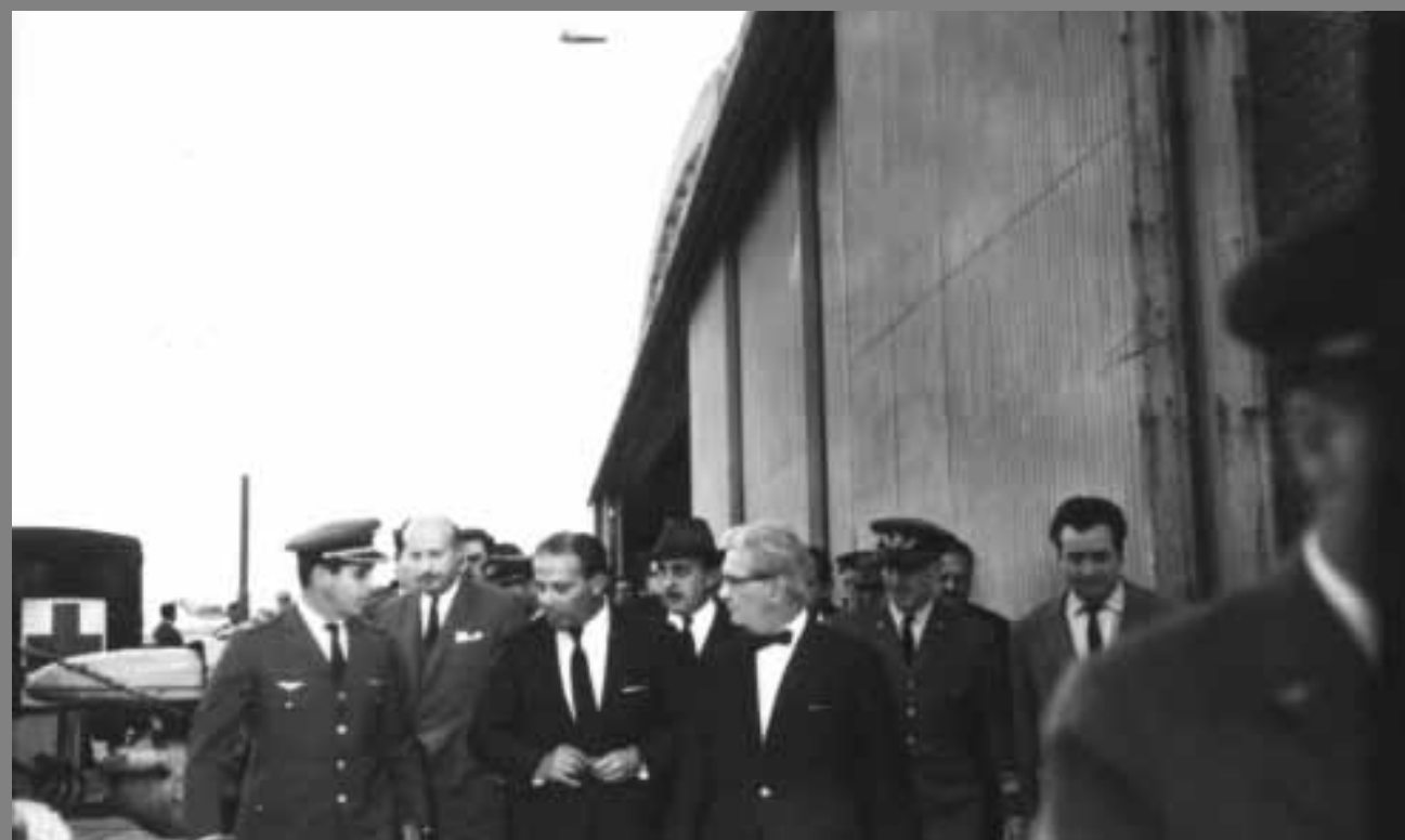
Chegada de João Goulart ao Uruguai, onde viveria a maior parte do seu exílio. Montevidéu, abril de 1964. João Goulart