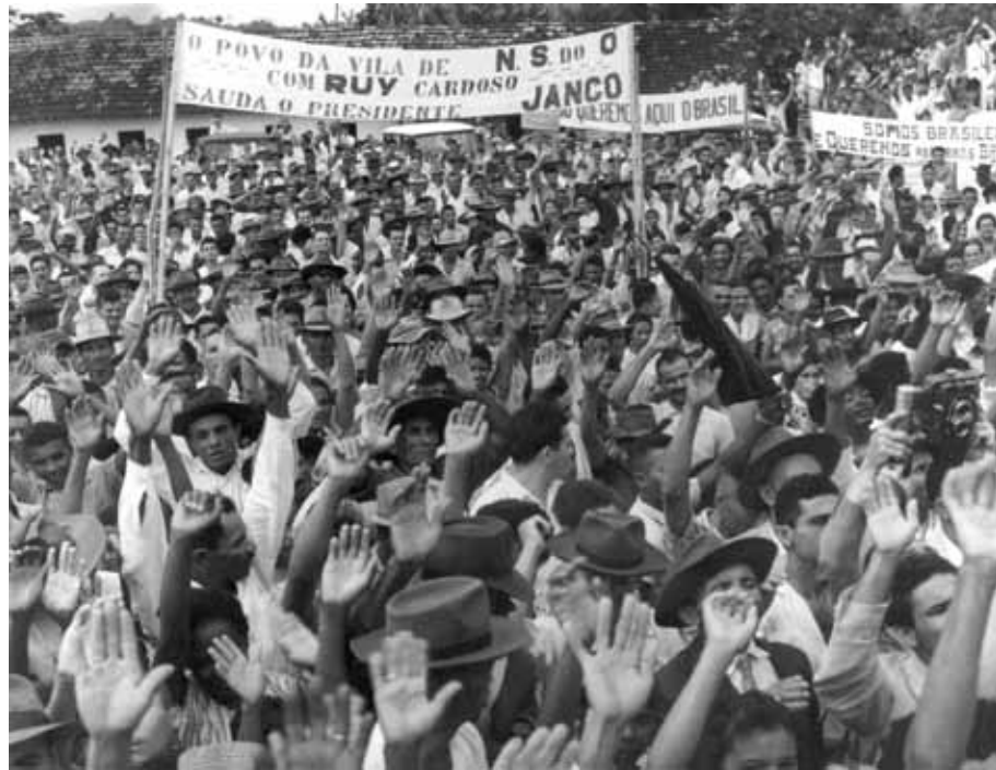
Comício de Jango. Recife, setembro de 1963. Correio da Manhã