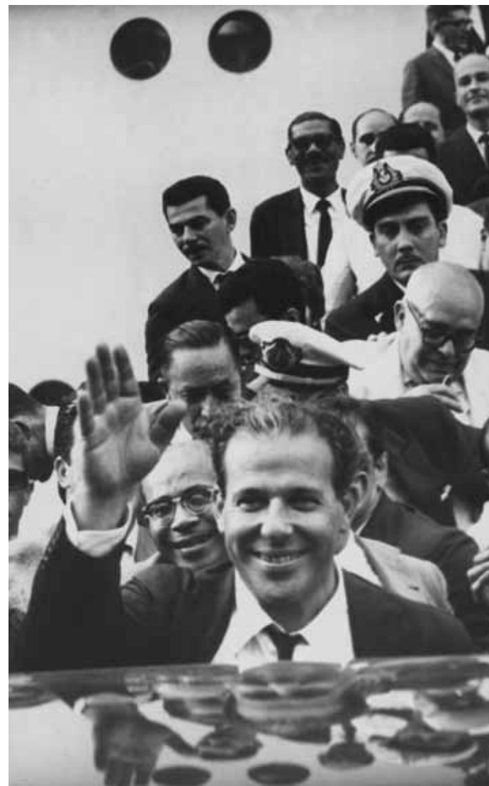
30 de julho de 1963. Correio da Manhã