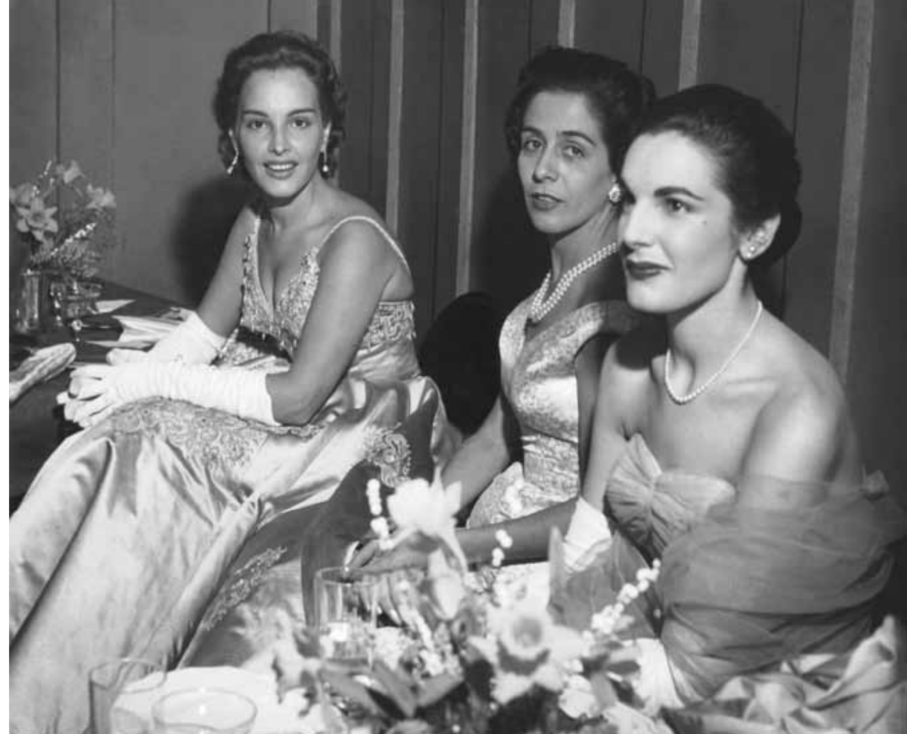
Maria Teresa Goulart durante viagem ao Canadá. S.I., maio de 1956. João Goulart