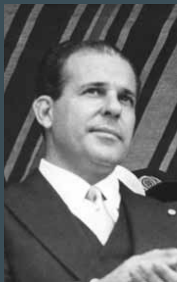
23 de setembro de 1962. Correio da Manhã