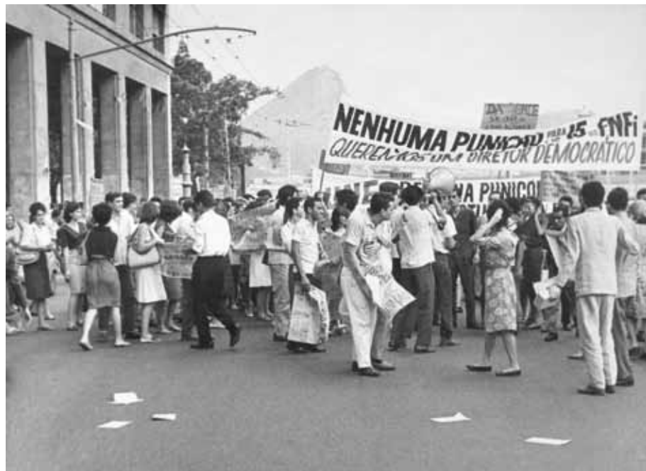
Estudantes da Faculdade Nacional de Filosofia. Rio de Janeiro, novembro de 1963.