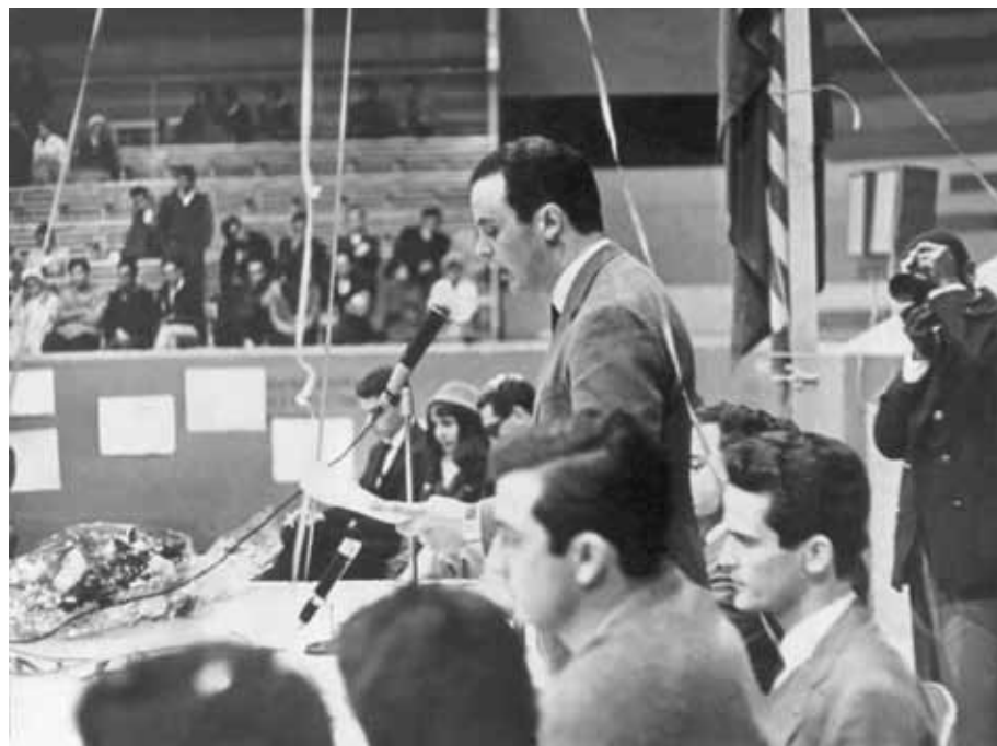
O recém-empossado presidente da UNE, José Serra. São Paulo, 30 de julho 1963.