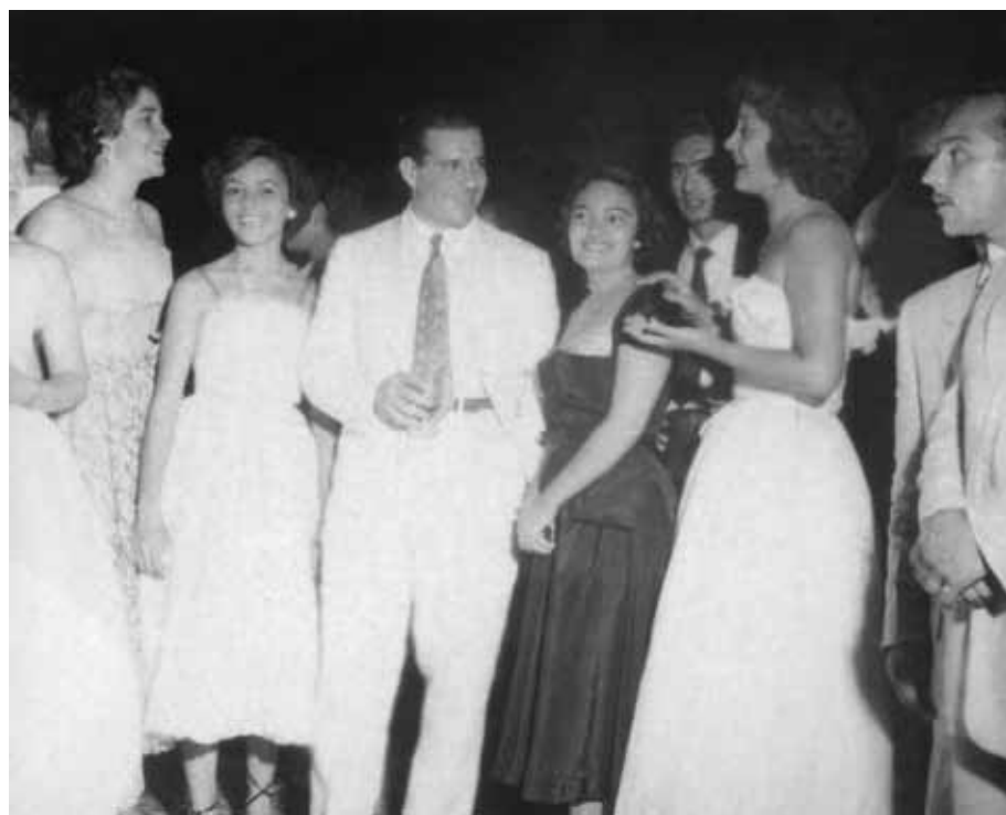
João Goulart, ministro do Trabalho visitando o interior do Ceará. Crato, outubro de 1953. João Goulart