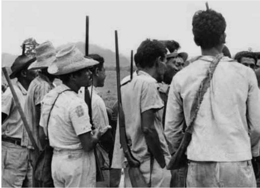
Posseiros do povoado de São José da Boa Morte decidem pegar em armas e lutar pelas terras após terem sido despejados. Cachoeiras de Macacu/RJ, novembro de 1963.

Francisco Julião, nascido em família proprietária de engenho em Pernambuco, bacharelou-se em direito e passou a defender, ainda na década de 1940, as causas camponesas no estado. Ingressou no Partido Socialista Brasileiro (PSB), pelo qual se elegeu deputado estadual, e na sua prática como advogado visitava engenhos, buscando organizar os trabalhadores. Sua atuação foi fundamental para a formação das Ligas Camponesas. S.I., setembro de 1963.