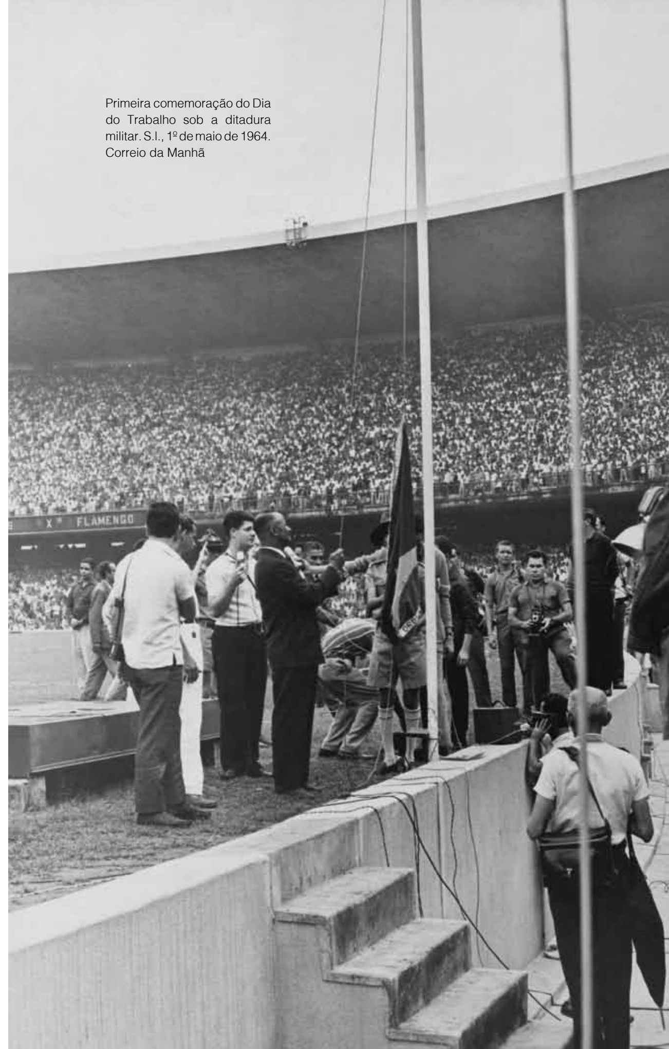
Primeira comemoração do Dia do Trabalho sob a ditadura militar. S.I., 1º de maio de 1964.