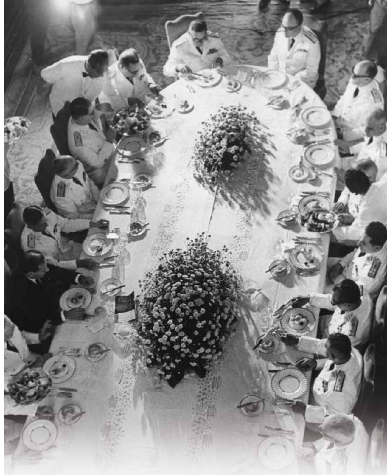
Apesar das aparentes boas relações entre o presidente Jango e os militares, a tensão e as conspirações golpistas já existiam desde o governo de Juscelino Kubitschek, e só se agravaram entre o final de 1963 e o início de 1964. Embora os militares já conspirassem abertamente e se articularassem com outros setores civis, o presidente acreditava que tinha apoio de alguns grupos leais das forças armadas e da população. Almoço oferecido pelo presidente João Goulart, no Palácio das Laranjeiras, aos generais promovidos em novembro de 1963. Rio de Janeiro, 20 de dezembro de 1963. Correio da Manhã