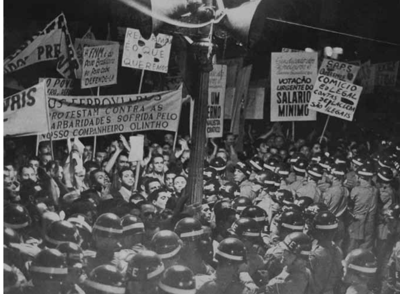
Comício marcando o aniversário da morte de Getúlio Vargas. Rio de Janeiro, 24 de agosto de 1963.