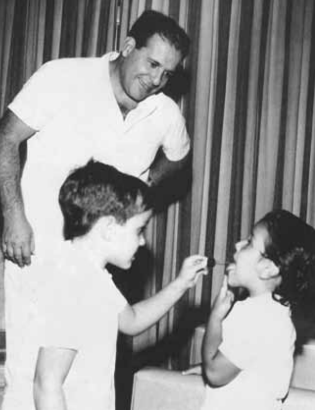
14 de abril de 1962. Correio da Manhã