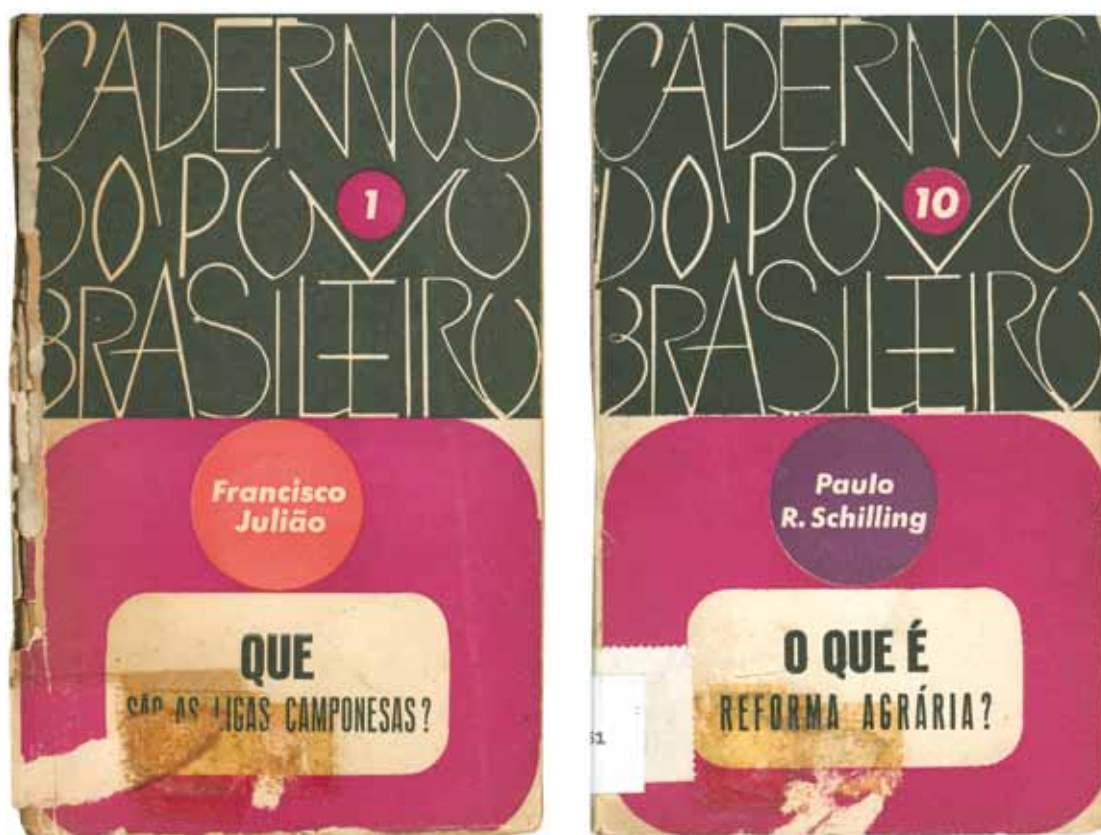
Francisco Julião Arruda de Paula. Que são as ligas camponesas? Rio de Janeiro: Civilização Brasileira, [1962]. Cadernos do povo brasileiro , v. 1.

Os Cadernos do povo brasileiro foram publicados pela editora Civilização Brasileira, de Ênio da Silveira, que juntamente com Álvaro Vieira Pinto organizou as publicações lançadas entre 1962 e 1964. Promovida pelo Iseb (Instituto Superior de Estudos Brasileiros), a série integrava o intenso debate acerca do modelo de desenvolvimento brasileiro, defendendo medidas de viés socialista para o país. Tal posicionamento era demonstrado explicitamente nos títulos de alguns dos livros: Que é a revolução brasileira? , Como seria o Brasil socialista? Impulsionada pela UNE, a divulgação dos Cadernos atingiu em cheio os meios sindicais (urbanos e rurais) e o movimento estudantil. Ênio da Silveira chegou a ser alvo de três Inquéritos Policiais Militares (IPM), nenhum dos quais resultou em condenação.