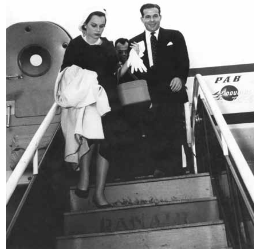
Desembarque de João Goulart e sua esposa Maria Teresa em retorno de viagem à Suíça. Rio de Janeiro, 16 de julho de 1957. João Goulart