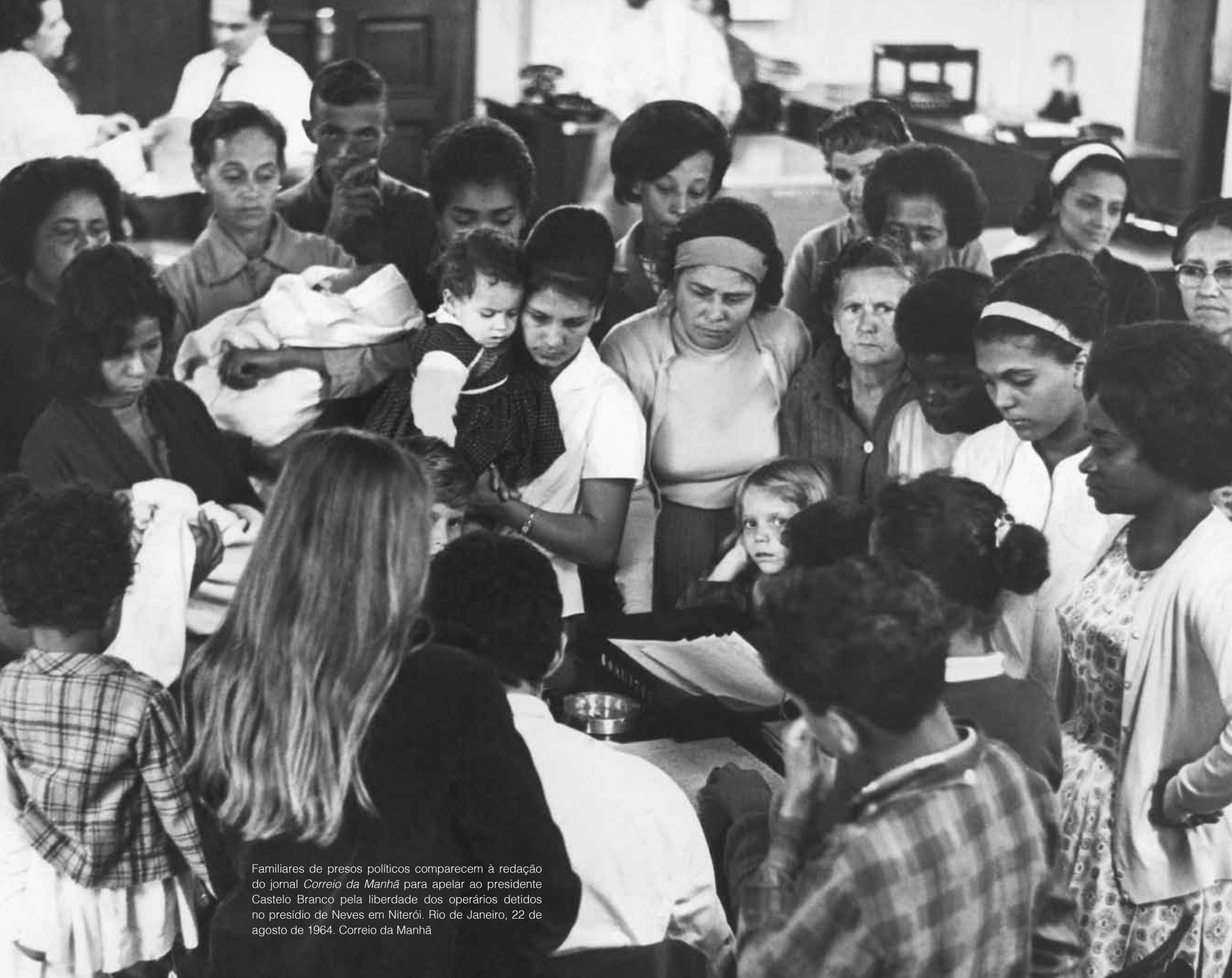
Famíliares de presos políticos comparecem à redação do jornal Correio da Manhã para apelar ao presidente Castelo Branco pela liberdade dos operários detidos no presídio de Neves em Niterói. Rio de Janeiro, 22 de agosto de 1964. Correio da Manhã