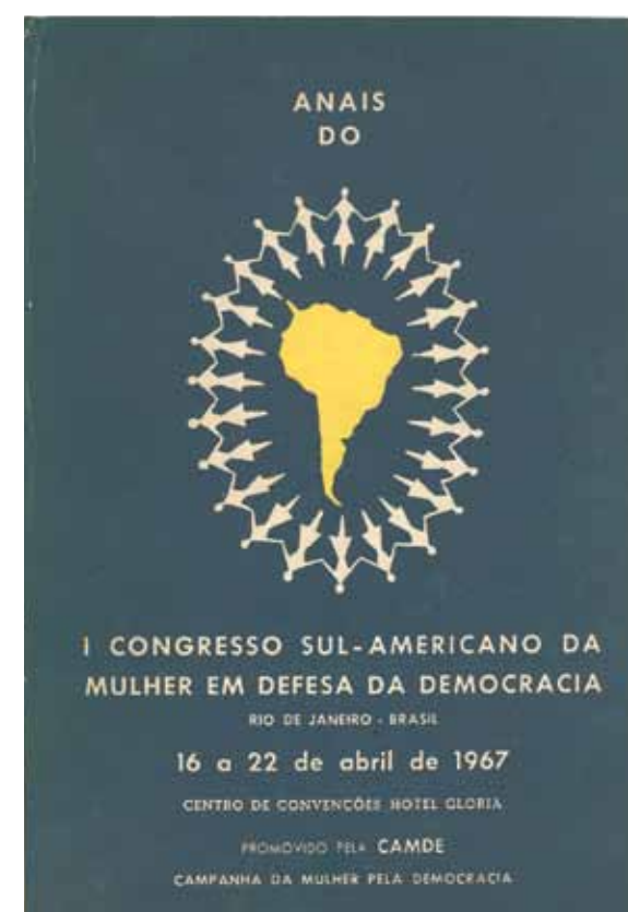
Congresso Sul-americano da Mulher em Defesa da Democracia. Anais . Rio de Janeiro: Campanha da Mulher pela Democracia (Camde), 1967.