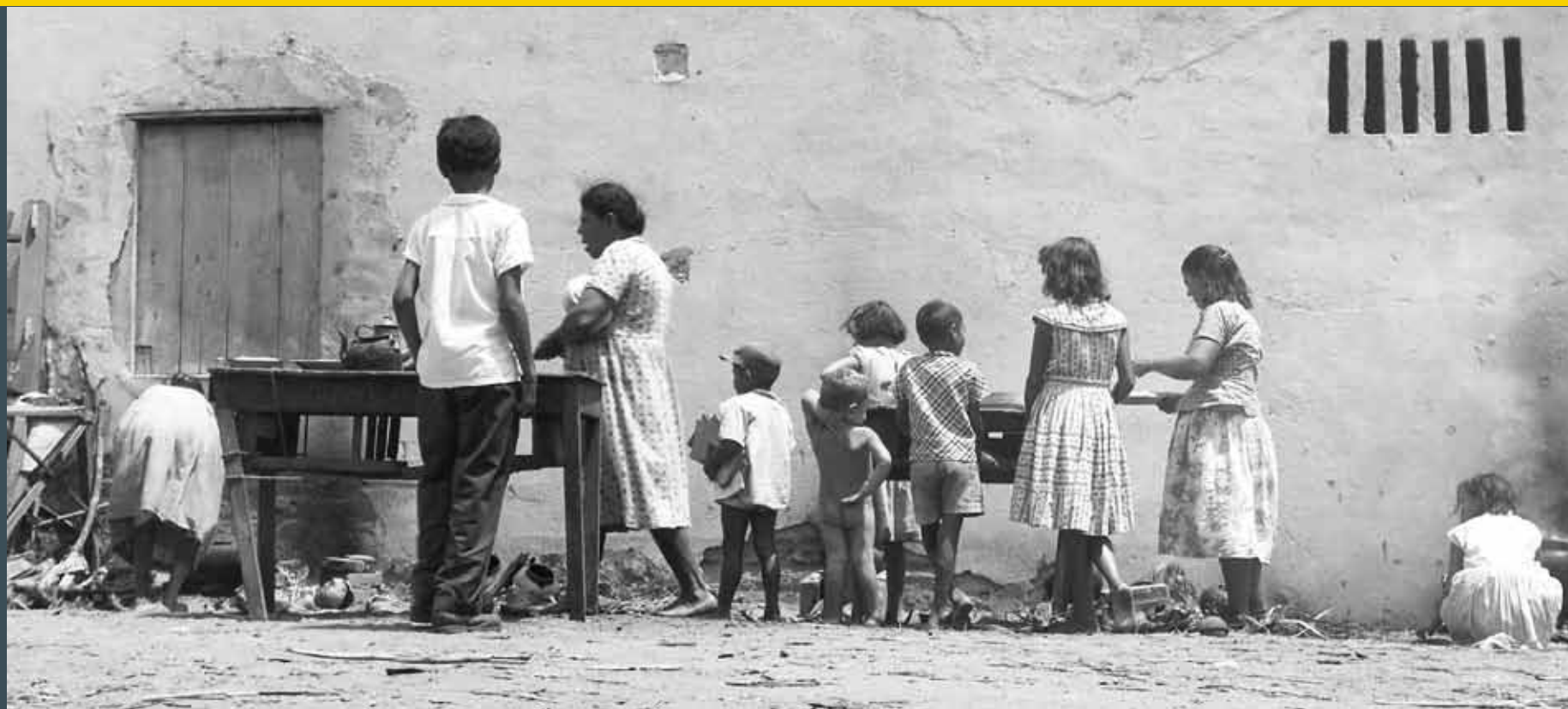
Polícia expulsa família de terras ocupadas. Pernambuco, 12 de janeiro de 1961. Correio da Manhã