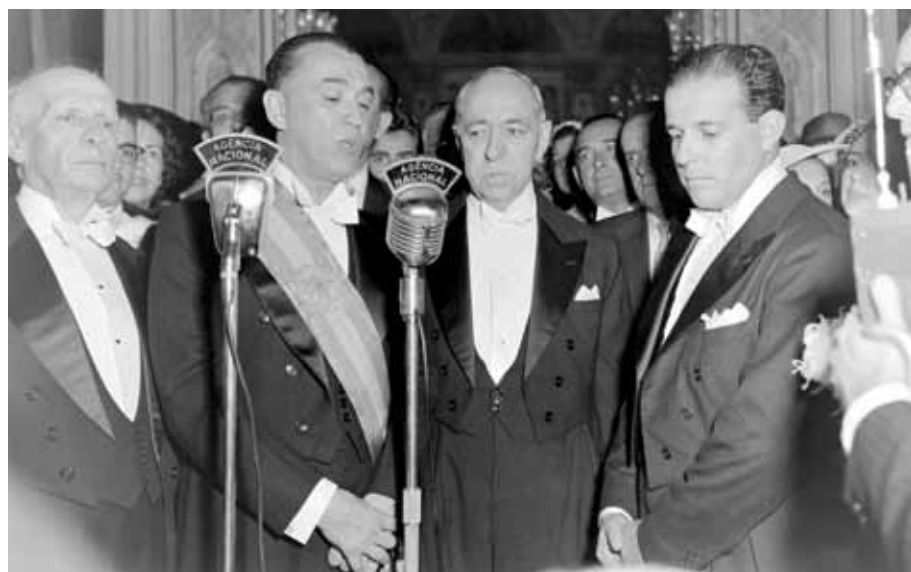
Posse do presidente Juscelino Kubitschek e de seu vice, João Goulart. Rio de Janeiro, 31 de janeiro de 1956.