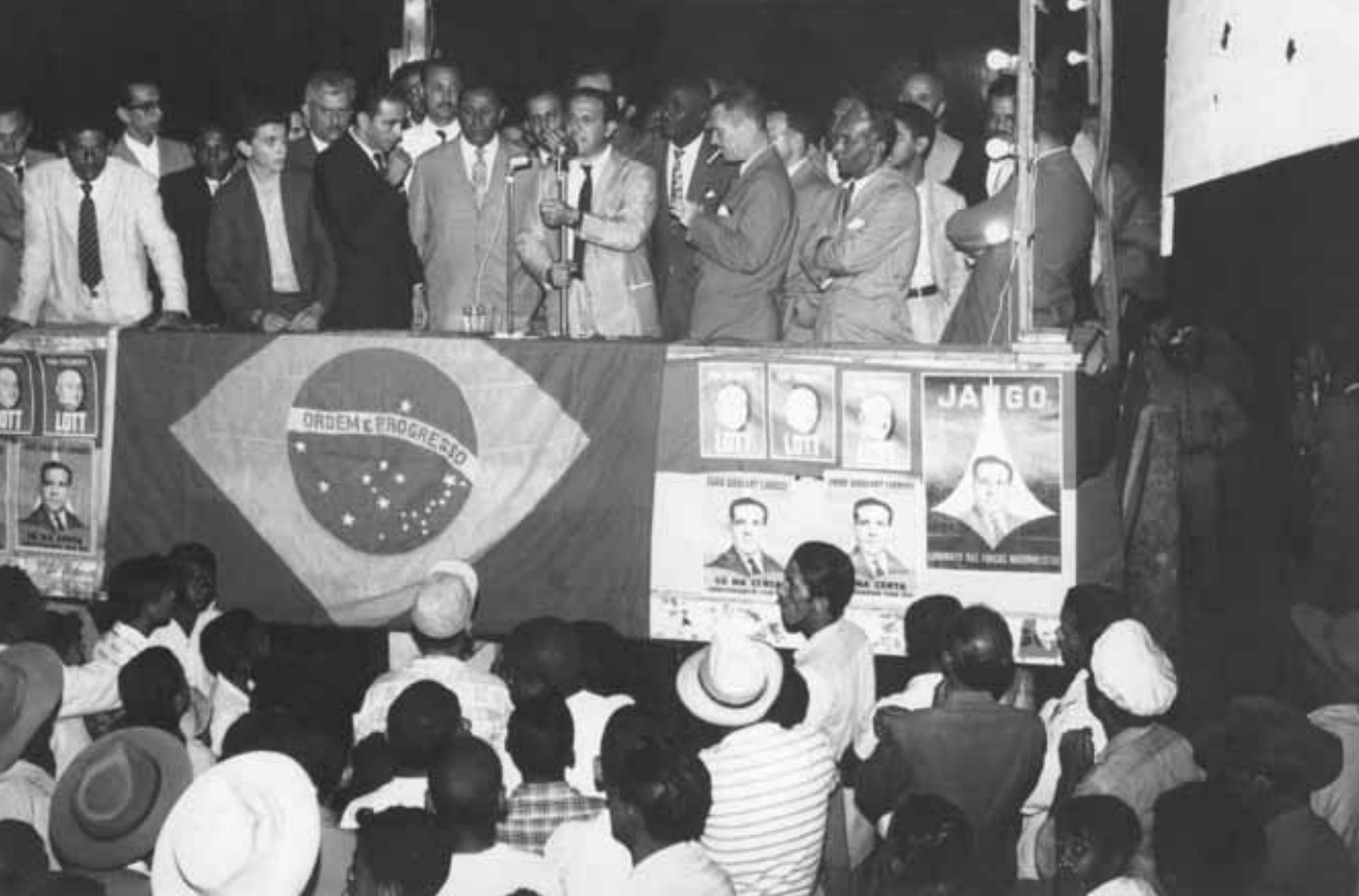
Comício de Jango na Bahia em campanha pela vice-presidência. Alagoínhas, 27 de agosto de 1960.