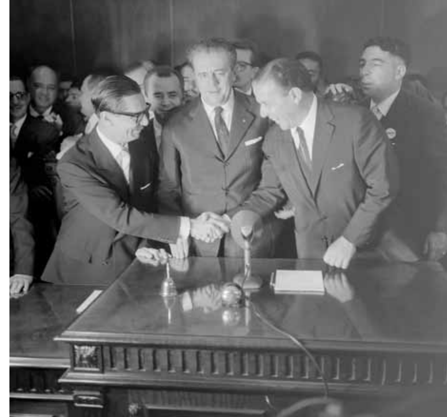
À frente da Missão Comercial Brasileira, o vice-presidente João Goulart é recepcionado na capital chinesa pelo vice-presidente Tung Pi-Vu e pelo primeiro-ministro Chu En-Lai. Pequim, 24 de agosto de 1961.